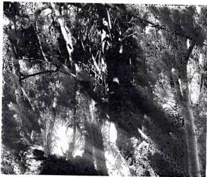
Foto 6. En esta foto se observan los rebrotes que han sido provocados por podas realizadas anteriormente.

Nota: Este dictamen no constituye autorización por parte de la PAOT.