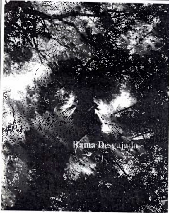
Foto 5. Esta rama desgajada deja vulnerable al árbol a enfermedades