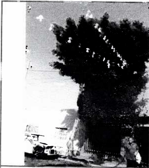
Fotografía 1. Ejemplar arbóreo que presenta poda de elevación de copa inapropiada