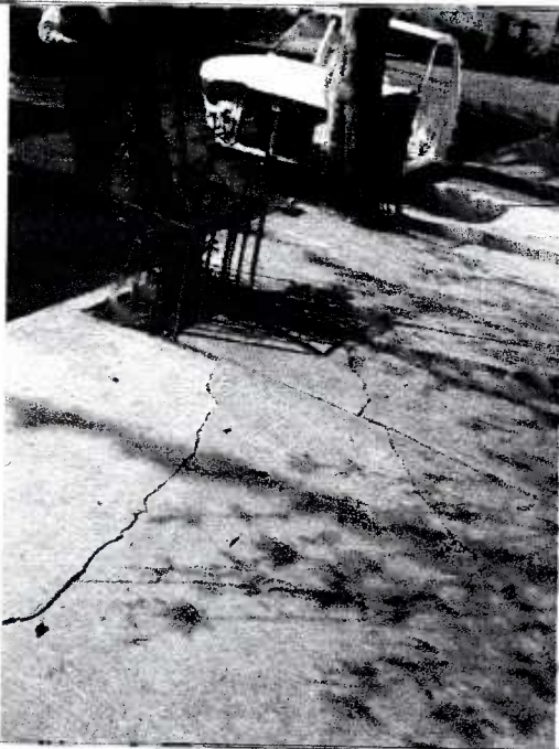
Fotografía 3. grietas producto del crecimiento de raíces