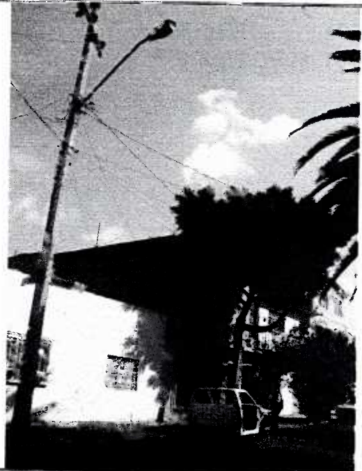
Fotografía 4. Cableado energizado y telefónico que interfiere con el follaje.

Nota: Este dictamen no constituye autorización por parte de la PAOT