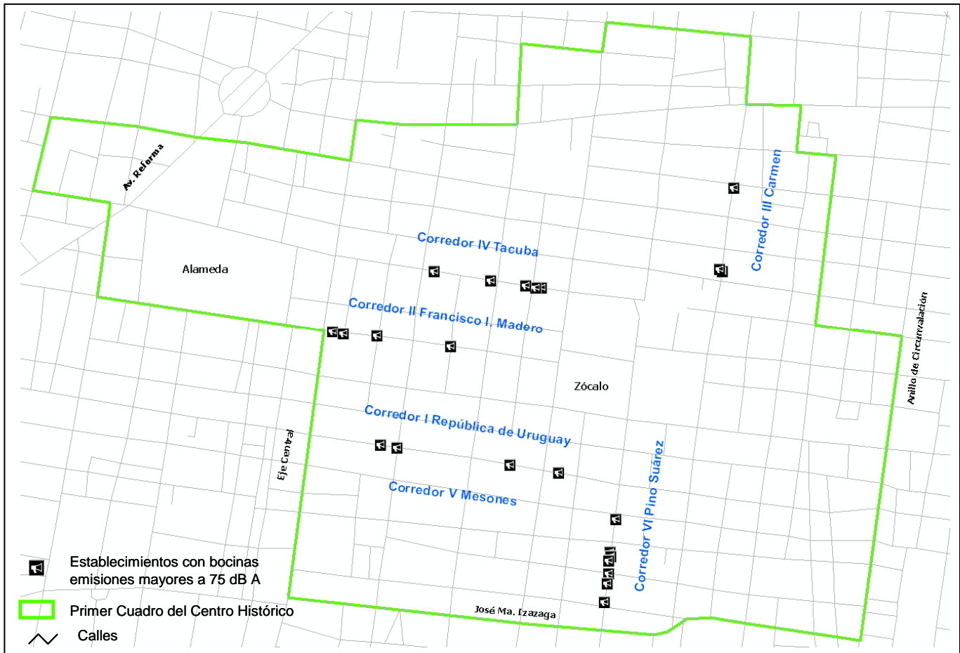
Imagen 3. Establecimientos con bocinas en donde se registran emisiones mayores a 75 dB A