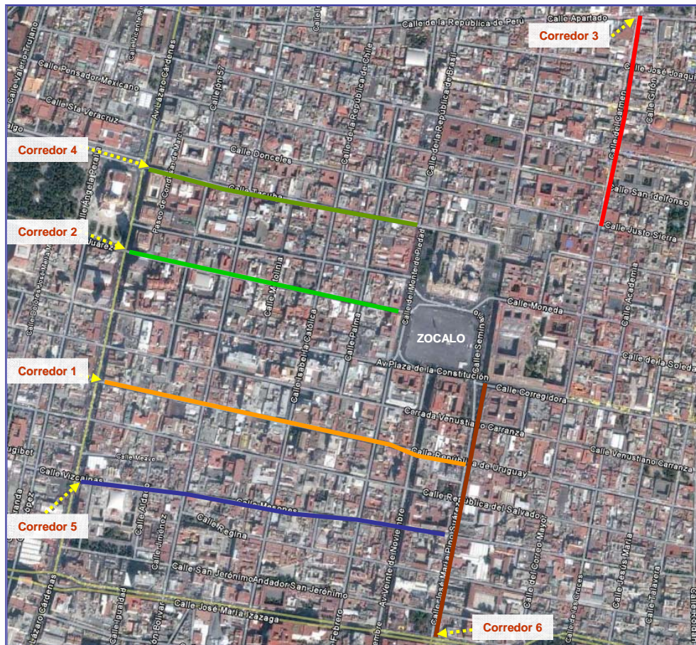
Imagen 1. Identificación de Corredores